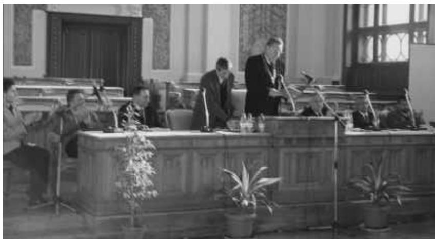
Festivitatea de aniversare a 35 de ani de la apariția revistei „Echinoc”, în Aula Universității „Babeș-Bolyai”

tipar și apoi revistele la chioșc. Mi-e dor de ICS Metalo-Chimice, așa se numea întreprinderea de care țineau tutungerile acelea din care cumpăram țigări „Carpați” sau „Mărășești” precum și chioșcurile în care se vindea presa, și care ne-a distrubuit în condiții de semiclandestinitate timp de mai mult de douăzeci de ani. Fără să-și dea măcar seama că eram într-un fel de ilegalitate. Mi-e dor și de mirosul acela de cerneală al șpalturilor și revistelor sub braț, miros cu totul dispărut astăzi când imprimantele scot doar pagini inodore.