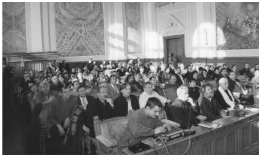
Festivitatea de aniversare a 35 de ani de la apariția revistei „Echinox”, în Aula Universității „Babeș-Bolyai”