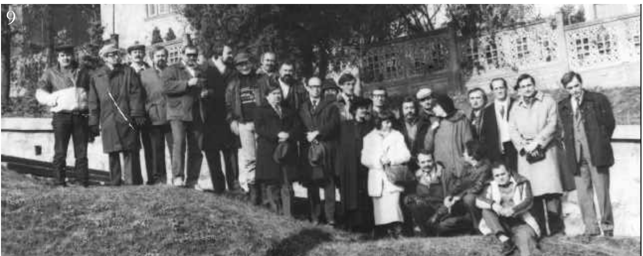
9. Gruparea „Echinox“ la festivitatea din 1988